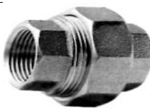
BOCCHETTONE DIRITTO F/F