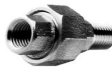
BOCCHETTONE DIRITTO M/F