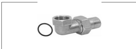
BOCCHETTONE 3 PEZZI M-F A GOMITO