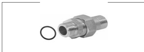
BOCCHETTONE 3 PEZZI M-M DIRITTO