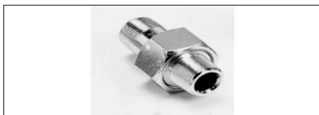
BOCCHETTONE 3 PEZZI M-M DIRITTO