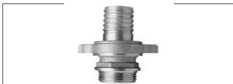
BOCCHETTONE 3 PEZZI M-PORTAGOMMA DIRITTO