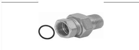
BOCCHETTONE 3 PEZZI M-F DIRITTO