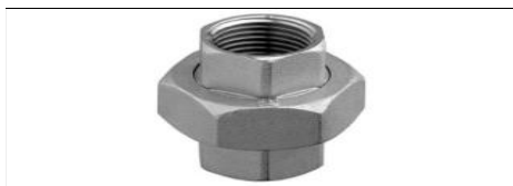
BOCCHETTONE 3 PEZZI F-F DIRITTO