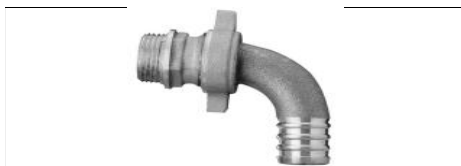
BOCCHETTONE 3 PEZZI M-PORTAGOMMA A GOMITO