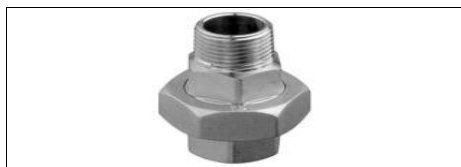
BOCCHETTONE 3 PEZZI M-F DIRITTO