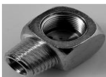
T QUADRO F-M-F CONICO