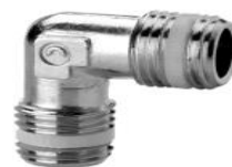
GOMITO M-M CONICO E SPRINT®