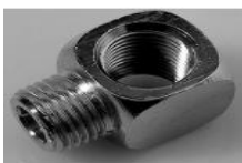
GOMITO QUADRO M-F CONICO