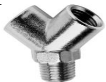
Y F-M-F CONICO