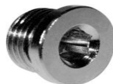
TAPPO MASCHIO TCCE CON O-RING