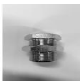
TAPPO MASCHIO TE CILINDRICO