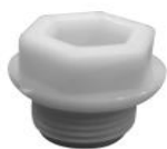
TAPPO MASCHIO PROTEZIONE FILETTI