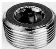
TAPPO MASCHIO A SCOMPARS A CONICO