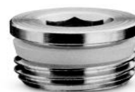
TAPPO MASCHIO TCCE SPRINT®