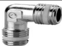
GOMITO M-M CONICO E SPRINT®