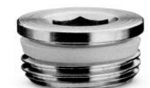
TAPPO MASCHIO TCCE SPRINT®