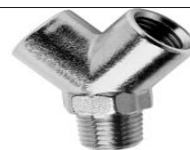
Y F-M-F CONICO