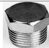
TAPPO MASCHIO TE CONICO