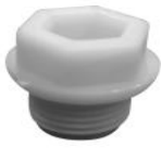
TAPPO MASCHIO PROTEZIONE FILETTI