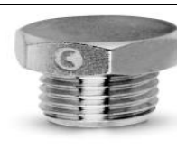
TAPPO MASCHIO TE CILINDRICO